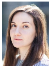
Первін Дадашова FRM Начальник управління макропроденційної політики та досліджень НБУ