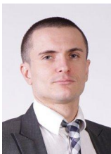
Віталій Ваврищук Директор департаменту фінансової стабільності НБУ