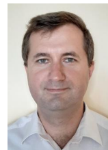
Микола Селехман FRM Заступник Директору Департаменту відкритих ринків НБУ