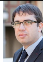
Ігор Будник Директор Департаменту управління ризиками НБУ